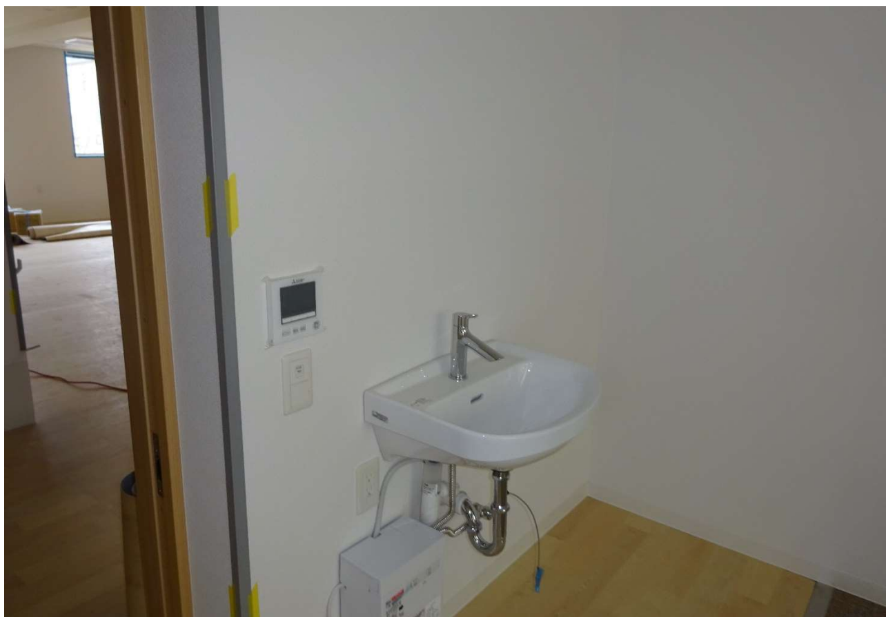
休憩室にも温水器付手洗いが付けられました。