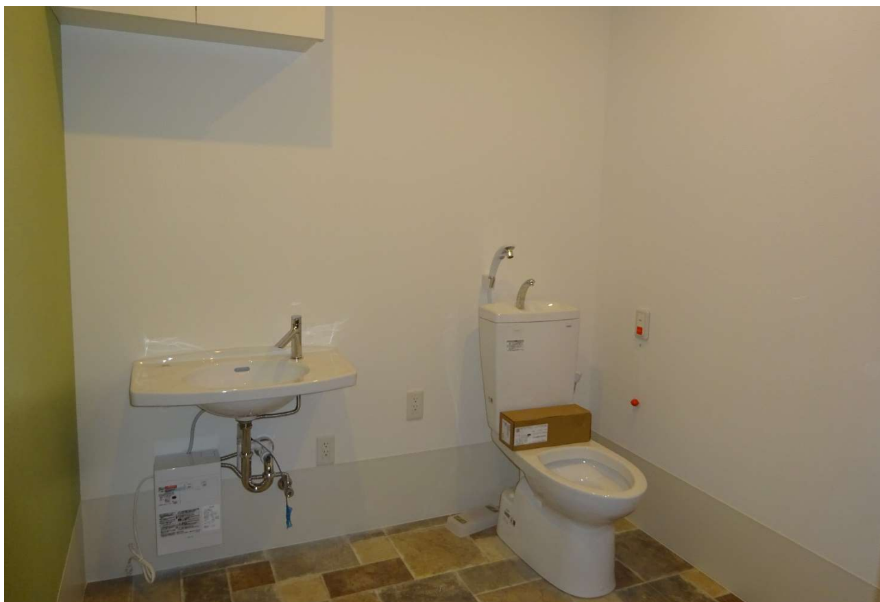
2階の共用トイレの内部です。