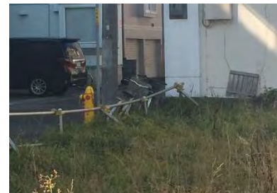
境界内自転車放置