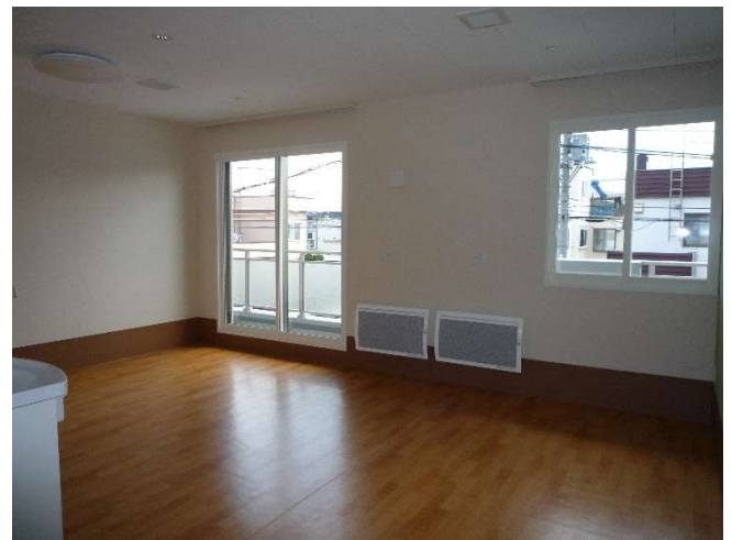
居室 2 F（2人部屋）