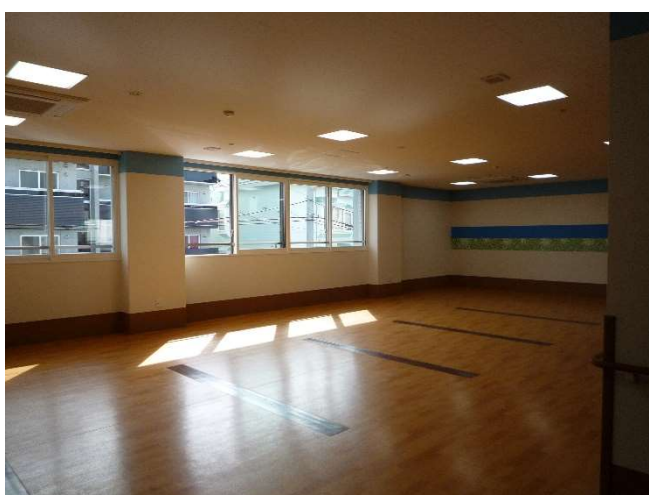
多目的室 2 F