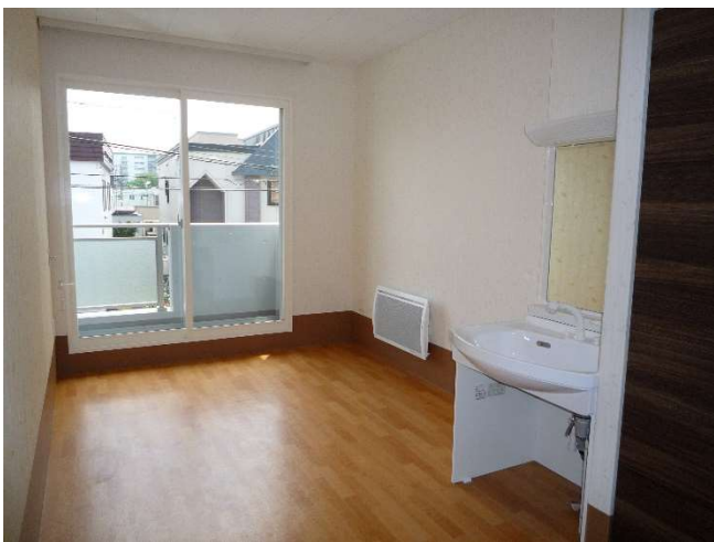
居室 2 F（個室）