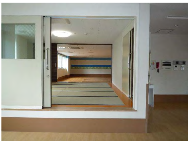
静養室（和室）とスタッフスペース 2 F