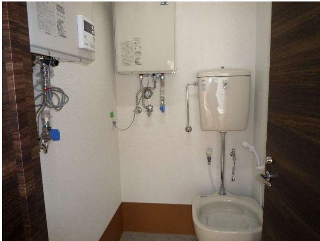
子供用和式トイレ 2F