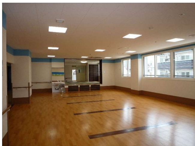
多目的室と静養室 2 F