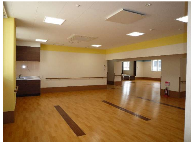
活動室（2） 2 F 手前側