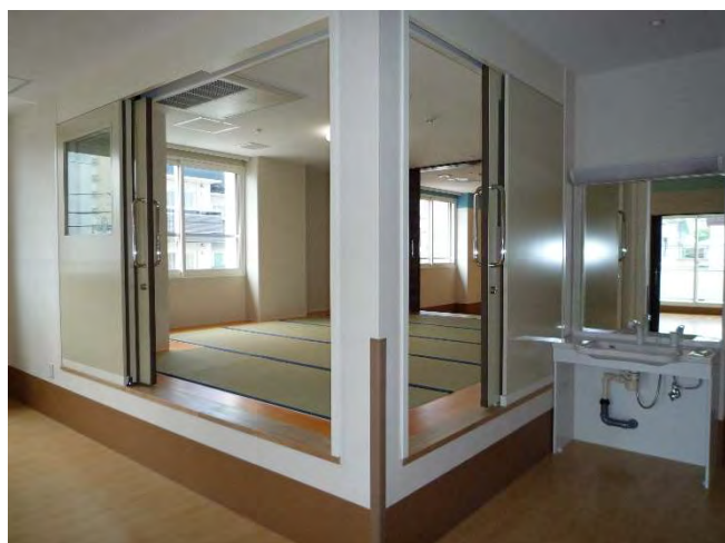
静養室（和室） 2 F