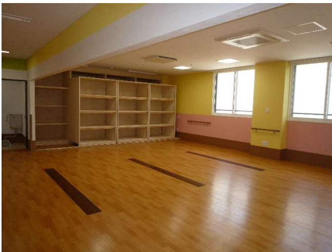
活動室（2） 2 F 奥側